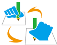
【筆談マーク】 所管：一般財団法人全日本ろうあ連盟