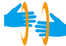
【手話マーク】 所管：一般財団法人全日本ろうあ連盟