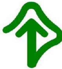
【耳マーク】 所管：一般社団法人全日本難聴者・中途失聴者団体連合会