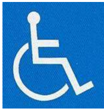
【障害者のための国際シンボルマーク】 所管：公益財団法人日本障害者リハビリテーション協会