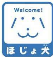
【ほじょ犬マーク】 所管：厚生労働省社会・援護局障害保健福祉部