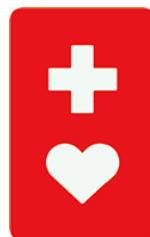
【ヘルプマーク】 所管：東京都福祉局障害者施策推進部企画課社会参加推進担当