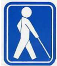
【盲人のための国際シンボルマーク】 所管：社会福祉法人日本盲人福祉委員会