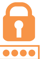
利用者証明用 パスワード (4桁)